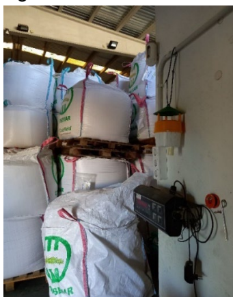
*Localització de les trampes per Spodoptera frugiperda .

Les trampes estaven ubicades a l'interior i en les immediacions del magatzem agrícola de l'empresa Ebrecultius, al polígon industrial Les Molines de Deltebre.